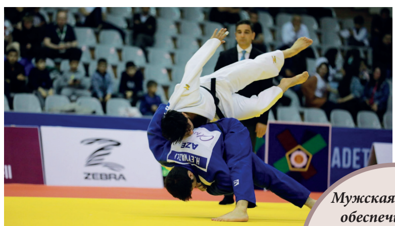
Мужская команда обеспечила себе вакансии во всех семи весах, а в женском зачете может быть представлена в трех

До завершения олимпийской квалификации в дзюдо остается два старта