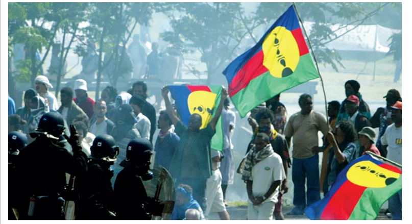
12 января в Новой Каледонии традиционно почтили память борцов за независимость.

Член правительства Новой Каледонии появился на французском телевидении с логотипом БИГ