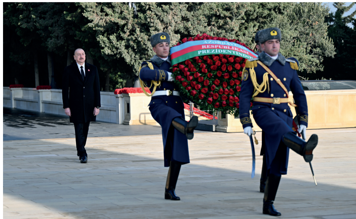
Президент Азербайджанской Республики Ильхам Алиев в Аллею шехидов почтил светлую память шехидов 20 Января.

Президент Ильхам Алиев почтил память шехидов 20 Января