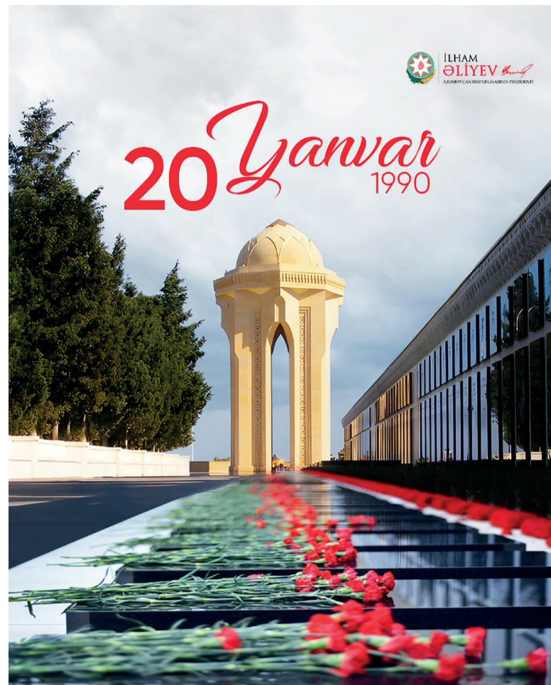
Президент Азербайджанской Республики Ильхам Алиев поделился в своих аккаунтах в социальных сетях публикацией в связи с трагедией 20 Января.