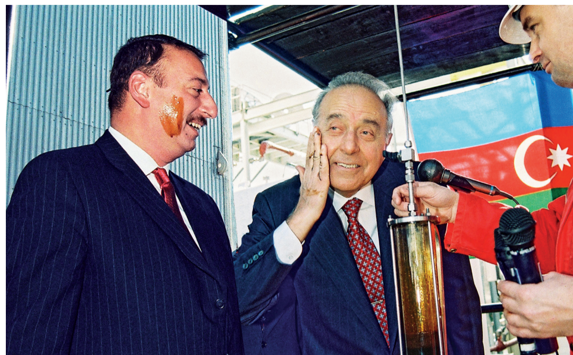
Баку-Тбилиси-Джейхан? С какими бы проблемами столкнулся Азербайджан? Какими могли быть сейчас позиции Азербайджана в мире? Конечно, представить это нетрудно. Главной предпосылкой уверенного развития Азербайджана в настоящее время является именно нефтяная стратегия, начатая великим лидером Гейдаром Алиевым в середине 1990-х годов. Эта нефтяная стратегия создала и будет создавать для нас большие возможности, которыми мы плодотворно воспользуемся».

Наиболее ярко о роли Гейдара Алиева в строительстве нефтепровода Баку-Тбилиси-Джейхан было сказано в обращении Президента Ильхама Алиева к азербайджанскому народу: « Давайте представляем, что было бы, если бы в 1994 году не был подписан «Контракт века»? Что было бы, если бы мы, благодаря усилиям Гейдара Алиева, в тяжелых условиях не приступили к строительству нефтепровода