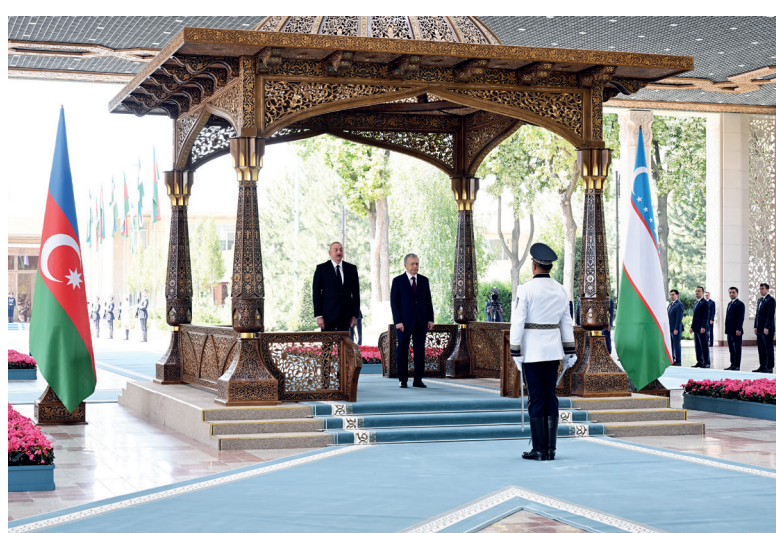
ша почетный караул прошел перед президентами. Было сделано совместное фото глав государств.