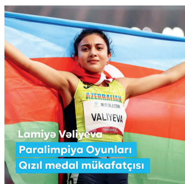
Lamiya Valiyeva Paralimpiya Oyunlari Qizil medal mukafatçisi

Представляем публикацию: «Ура! Наша очередная победа! Четырехкратная чемпионка мира Ламия Велиева завоевала золотую медаль на летних Паралимпийских играх «Париж-2024»! От всей души поздравляю нашу спортсменку! Спа-