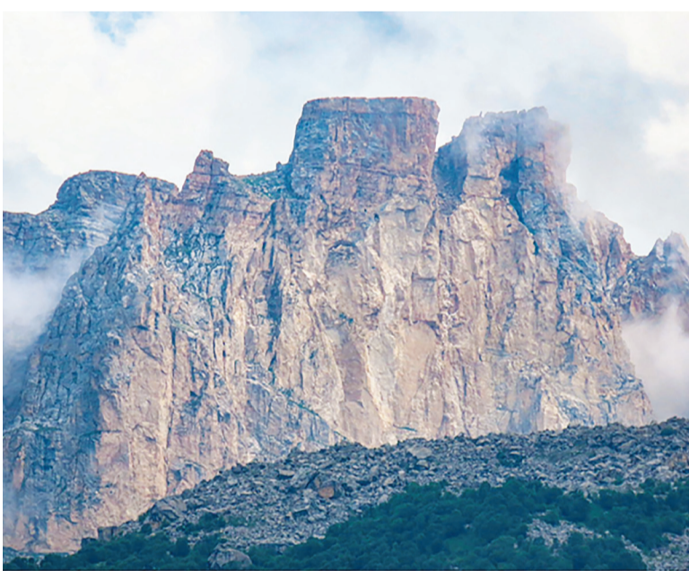
Величественная гора Кяпяз словно оберегает всю эту красоту

- Необходимо отметить, что на территории национального парка се-