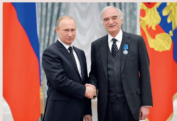
Президент России Владимир Путин наградил Полада Бюльбюлюглу орденом Александра Невского.

Президент России наградил Полада Бюльбюлюглу