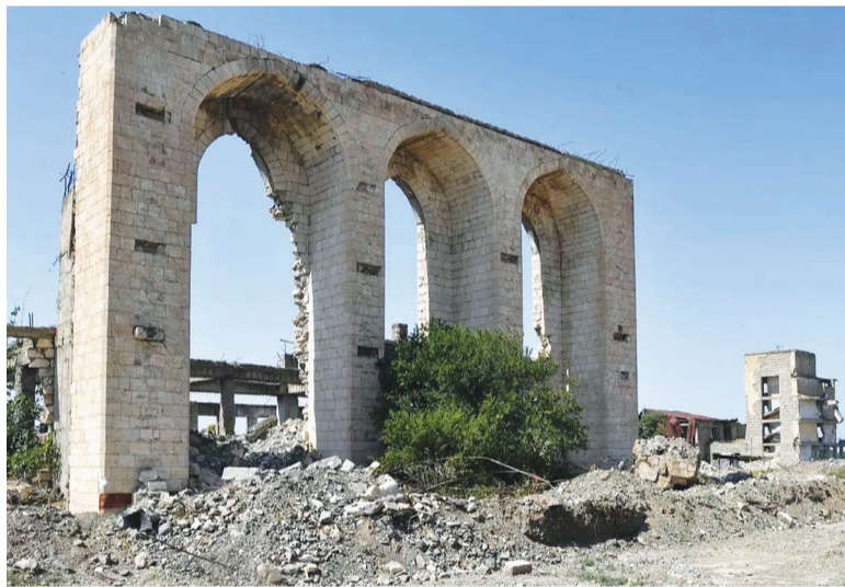
Разрушенное здание драматического театра в Агдаме

Армения увлеклась милитаризацией, и ее варварские аппетиты растут в геометрической прогрессии. На этом фоне глава внешнеполитического ведомства страны рассказывает сказки иностранным представителям о том, как его страна вынашивает идеи «культурного диалога и сотрудничества ради укрепления взаимопонимания и толерантности». Ему не словоблудием заниматься надо, а кон-