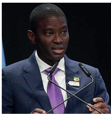
Премьер-министр Гренады Дикон Митчелл

ми, но душит их экономическими соглашениями, вынуждает подчиняться транснациональным корпорациям, уничтожает традиционные экономические системы, превращает некогда процветающие земли в сырьевые придатки, паразитируя на их ресур-