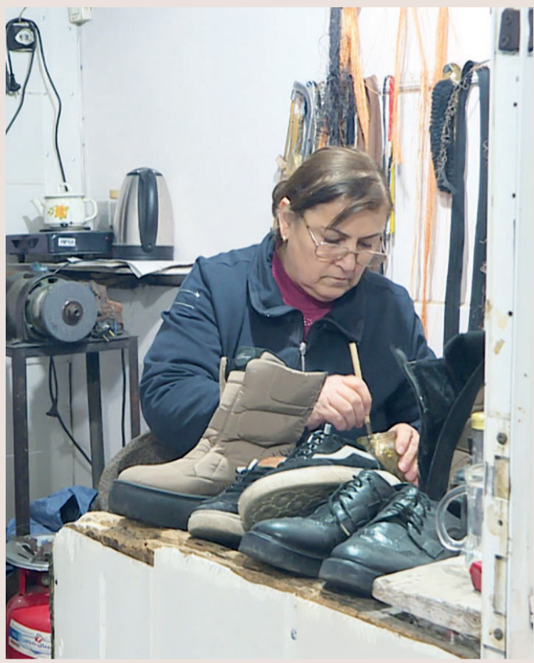
Мужское сапожное ремесло в женском исполнении

- Все-таки сапожник - мужская профессия. Вам не было страшно, что не справитесь?